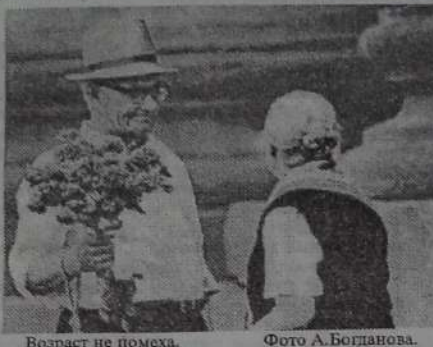
Возраст не помеха.